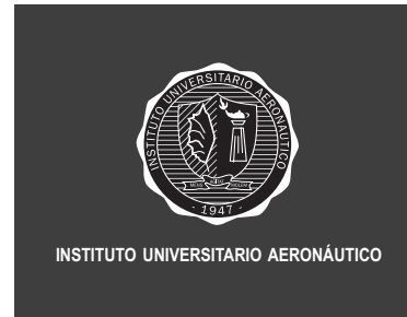
Blanco y negro / Sobre fondo oscuro