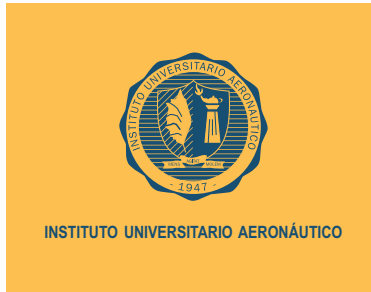
Sobre fondo amarillo

Se debe respetar el criterio de asociación del escudo con el fondo en el que se inserta, cuidando de utilizar el escudo de borde amarillo para fondos oscuros, y el de borde azul para fondos claros.