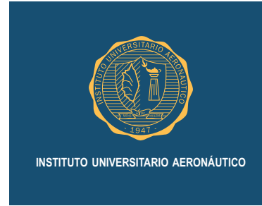
Sobre fondo azul