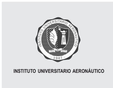
Blanco y negro / Sobre fondo claro