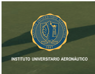
Sobre entorno fotográfico oscuro